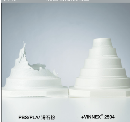
实现 PBS/PLA 混合物的热成型

由 PLA/PBS/滑石粉混合物制成的热成型部件。添加 VINNEX® 粉末树脂可实现理想的材料热成型效果。