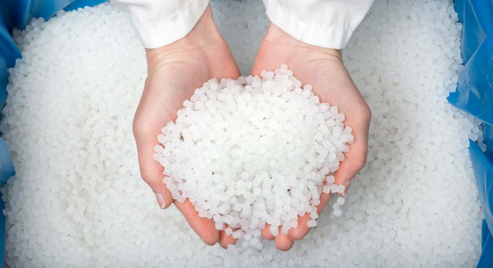
Pelletiertes Siliconadditiv der Marke GENIOPLAST® mit einem Silicongehalt von 70 Prozent.