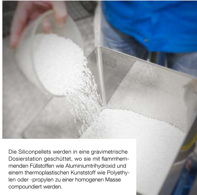
Die Siliconpellets werden in eine gravimetrische Dosierstation geschüttet, wo sie mit flammhemmenden Füllstoffen wie Aluminiumtrihydroxid und einem thermoplastischen Kunststoff wie Polyethylen oder -propylen zu einer homogenen Masse compounding werden.