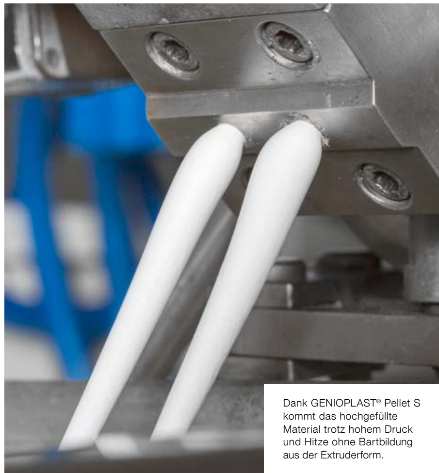
Dank GENIOPLAST® Pellet S kommt das hochgefüllte Material trotz hohem Druck und Hitze ohne Bartbildung aus der Extruderform.

geringem Aufwand in die unterschiedlichsten thermoplastischen Compounds einarbeiten lässt. Es besteht aus einer granulierten, hochkonzentrierten Siliconpolymer-Formulierung mit einem Silicongehalt von 70 Prozent. Als Trägermaterial dient eine pyrogene Kieselsäure, deren Eigenschaften auf das eingesetzte Polydimethylsiloxan abgestimmt sind. Verarbeitet wird es einfach durch Zugabe zum Grundkunststoff in einen Doppelschneckenextruder oder in einen Co-Knetter und anschließender Extrusion. Die pyrogene Kieselsäure bewirkt, dass das Additiv mit sämtlichen Thermoplasten und thermoplastischen Elastomeren kompatibel ist.