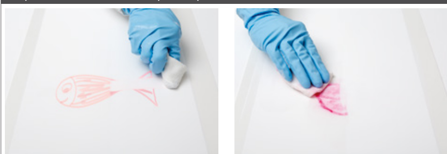
Marcadores de textos. Izquierda: formulación de la pintura sin PRIMIS® SAF 9000. Derecha: pintura modificada con PRIMIS® SAF 9000.