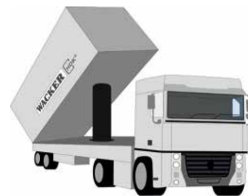
Livraisons en vrac

Autres formats de conditionnement de HDK® disponibles sur demande.