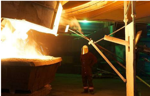
Herstellung von Silicium-Metall in Holla