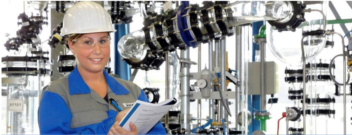
Chemikantin im Berufsbildungswerk Burghausen