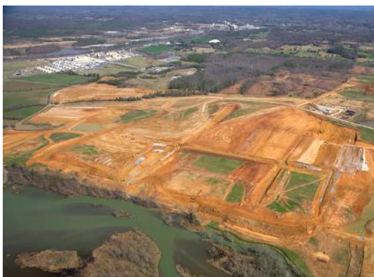
Baufeld im Überblick