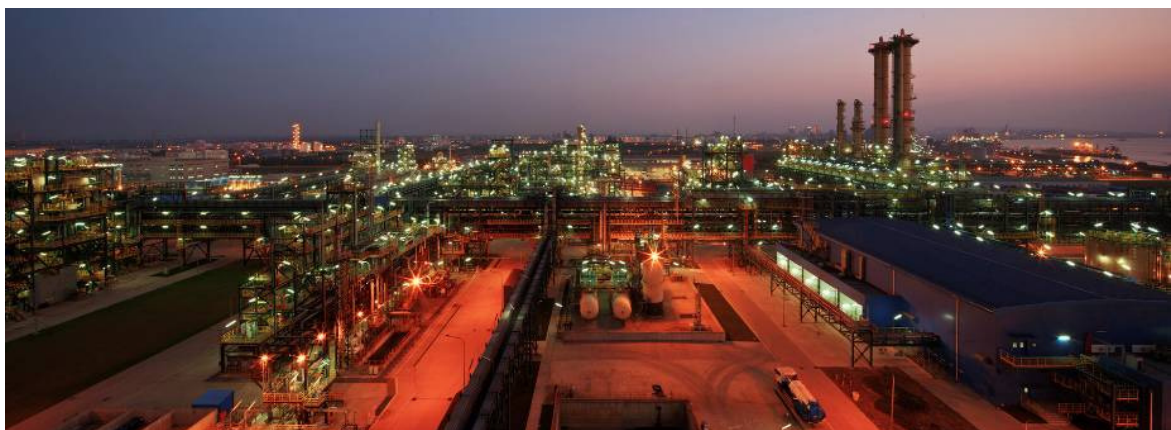
Zhangjiagang ist der größte integrierte Silicon-Standort der Welt