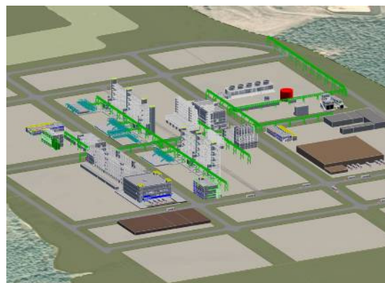
Layout der Gesamtanlage