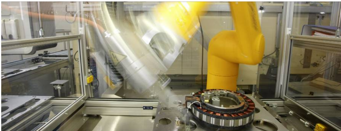
Roboter bei der Produktion eines PKW-Hybridmoduls