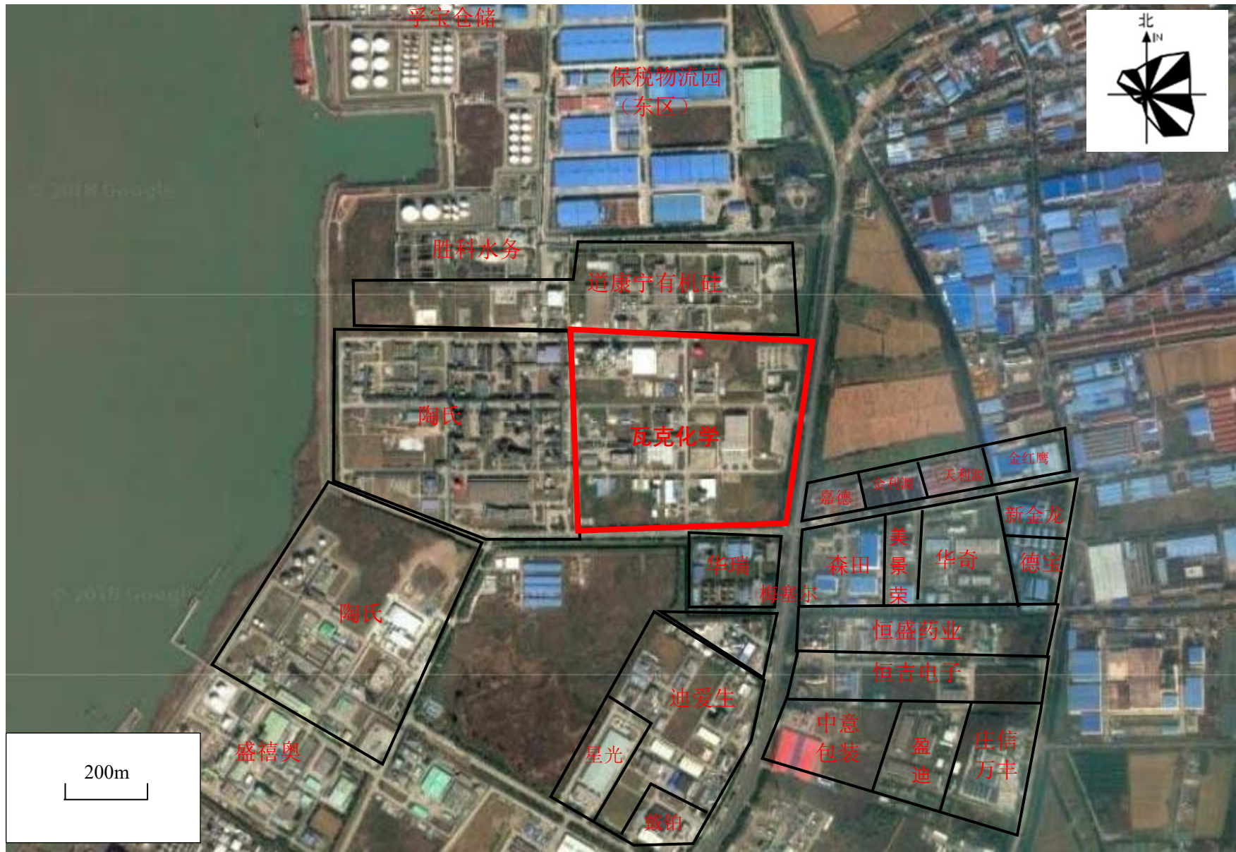
附图2 项目周边环境概况图